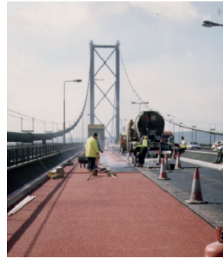
Keliai ir tiltai

Polimerais modifikuota bituminė juosta siūlių keliuose sandarinimui tarp asfalto, betono ir kitų konstrukcijų. Lankstumo savybė leidžia patikimai sandarinti deformacines siūles. Juosta puikiai tinka oro uostų pakilimo takų remontui, lengvųjų traukinių ir tramvajų bėgių remontui bei statyboje, kur reikia elastingos siūlės tarp konstrukcijos ir asfalto. Premband suformuoja lanksčią, vandeniui nelaidžią siūlę, leidžiančią kelio deformacinius judesius, sąlygojamus eismo ir temperatūrinių svyravimų, taip apsaugant siūlę nuo skilimo, dėvėjimosi ir užterštumo.